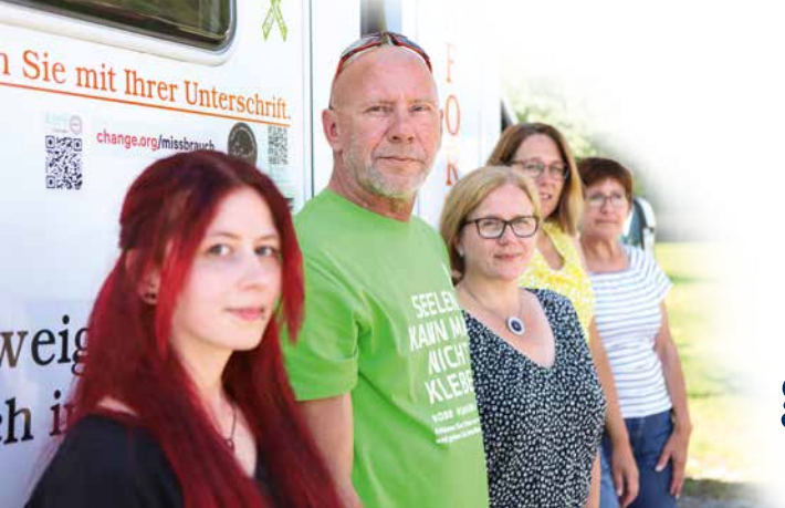
Der Vorstand von Tour41 e. V. mit seinem Infomobil.