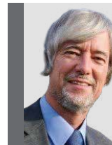
Thomas von Holt Rechtsanwalt | Steuerberater www.vonholt.de

EuGH, Urteil v. 22.09.2022 – C – 518/20.