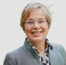
Eva Maria Welskop-Deffaa Caritas-Präsidentin

neuen Ring um den Markenkern der Caritas. Die Interpretationshoheit zu halten ist da nicht leicht. Vielleicht sieht manch einer im Kreuz unseres Logos schlicht das Pluszeichen. Auch das ist nicht falsch. Denn die Marke Caritas steht für das große UND. Alt und Jung, Menschen mit Migrationsgeschichte und mit Beeinträchtigung, Menschen mit Suizidgedanken und Menschen ohne Wohnung – für sie alle wollen wir die passenden Angebote vorhalten. Heute und morgen. 🌱