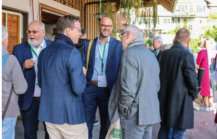
Die Mitglieder des Netzwerks SONG besuchten verschiedene Einrichtungen der Samariterstiftung.