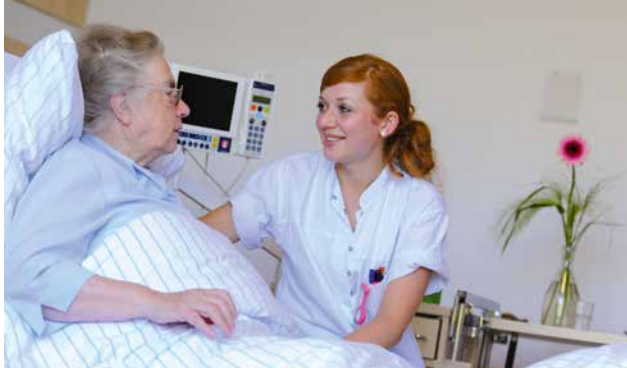
Herzliche Betreuung, kompetente Pflege und moderne Medizin im Caritas-Krankenhaus.

Migrationsberatung, in den Kindergärten die Unterstützung leisten, die dringend notwendig ist. Ich bin immer wieder neu dankbar, dass sich Menschen für soziale Arbeit als Beruf entscheiden – in Pflegeeinrichtungen, in der Eingliederungshilfe, als Erzieherin, als Beratungsfachkraft. Und ich weiß, dass wir nur mit unseren freiwillig Engagierten die schnelle Krisenhilfe leisten können, die bei der Ahrflut, in den Bahnhofsmissionen, für Lesepatenschaften und in der Energiesparbegleitung gebraucht wird. Wir müssen in unserer Gesellschaft mit großer Aufmerksamkeit aufeinander aufpassen und als Caritas mit Zukunftsmut vorangehen. Nur so kann es uns gelingen, die Herausforderungen unserer Zeit zu bewältigen, nur so können wir verhindern, dass unsere Gesellschaft auseinanderdriftet.