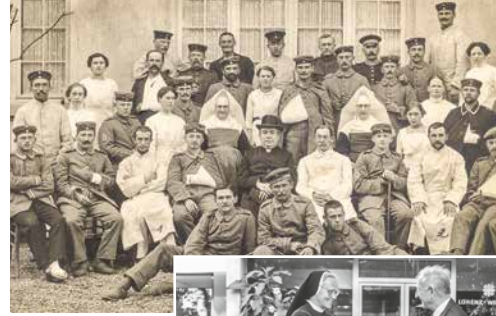
Der erste Caritas-Präsident Lorenz Werthmann bei einem Besuch in einem Lazarett 1914.

Auch schon vor 30 Jahren auf den Straßen in Deutschland präsent – die Autos der ambulanten Dienste und Sozialstationen.